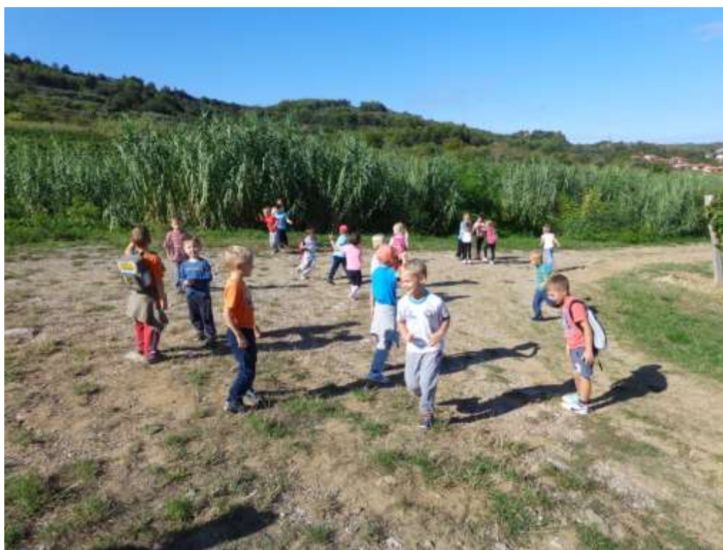
Slika 10: Pohod v neznano