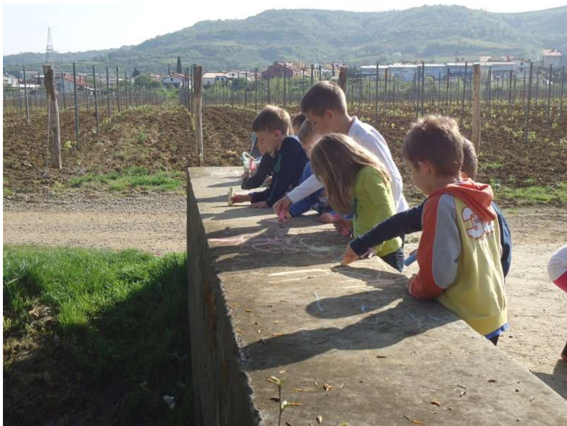
Sliki 15 in 16: Rišemo s kredami.