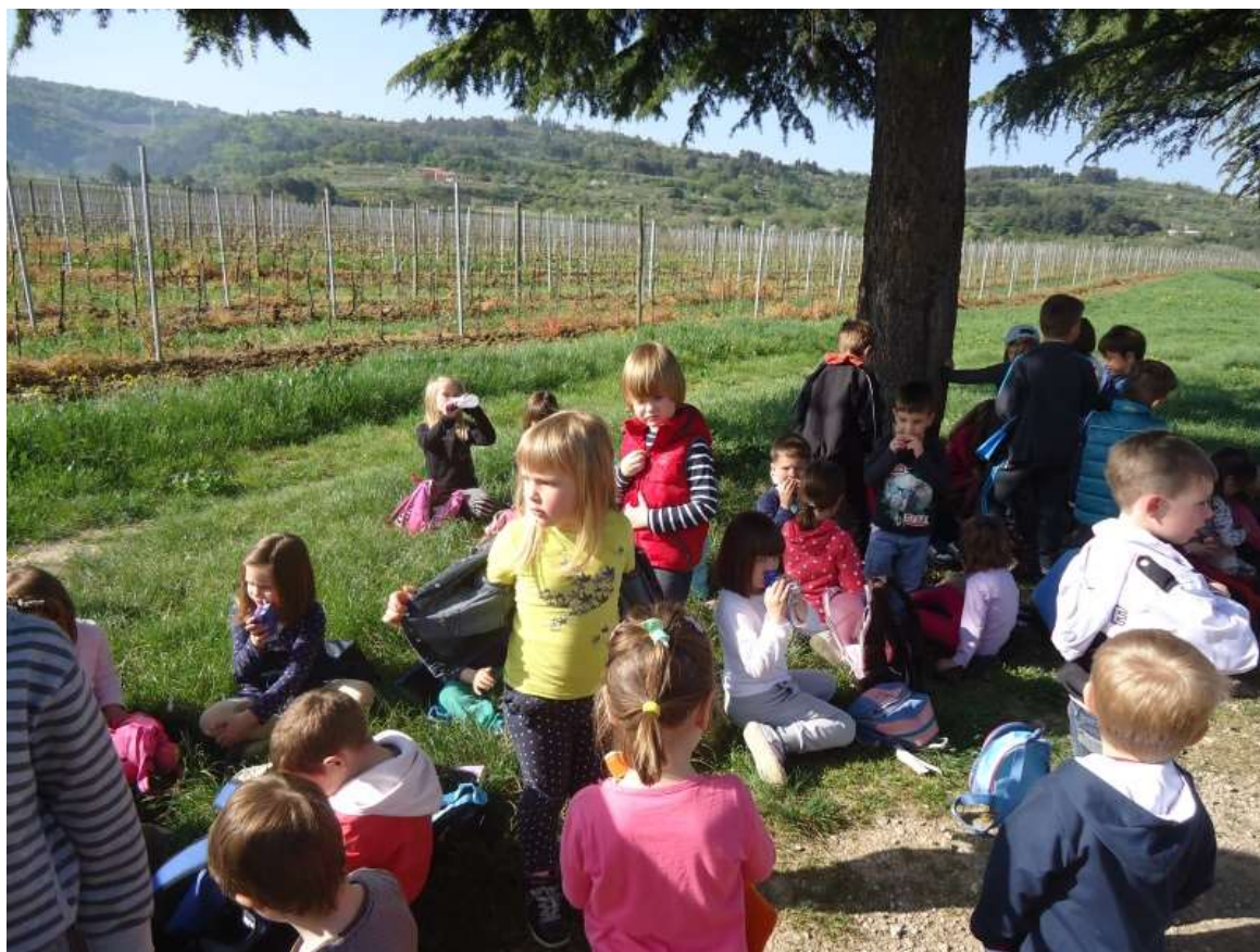
Sliki 9 in 10: Piknik v vinogradu ter vlečenje vrvi.