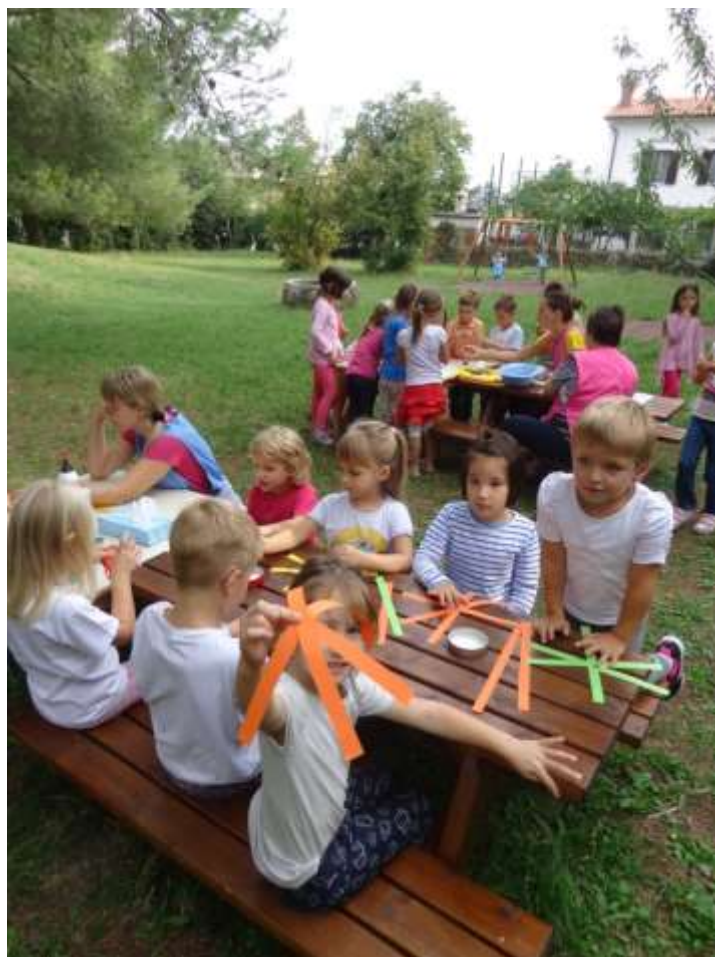
Sliki 1 in 2: Ustvarjalne delavnice na vrtčevem igrišču.