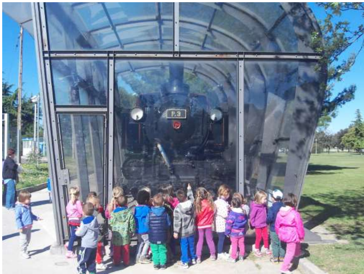
Slike 32 in 33: Stara lokomotiva, ladijski vijak, ... del obalne dediščine.