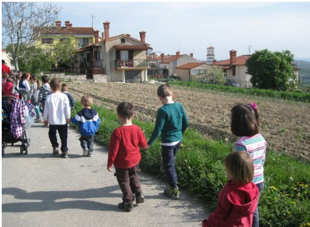
Sliki 4 in 5: Okolica Kort.