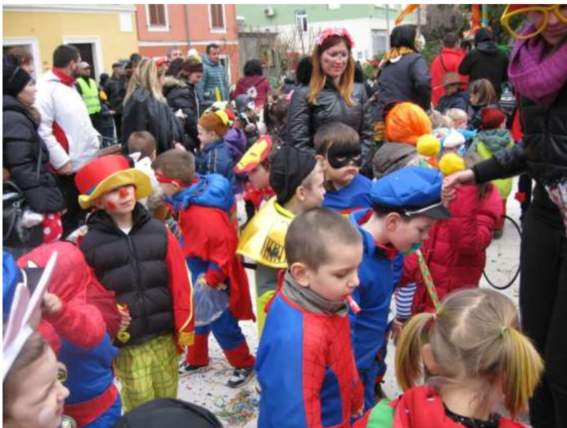
Slika 9: Pustno rajanje v parku Pietro Coppo