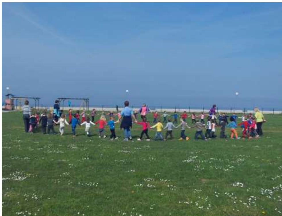
Slika 26: Praznovanje prvega pomladnega dne v San Simonu