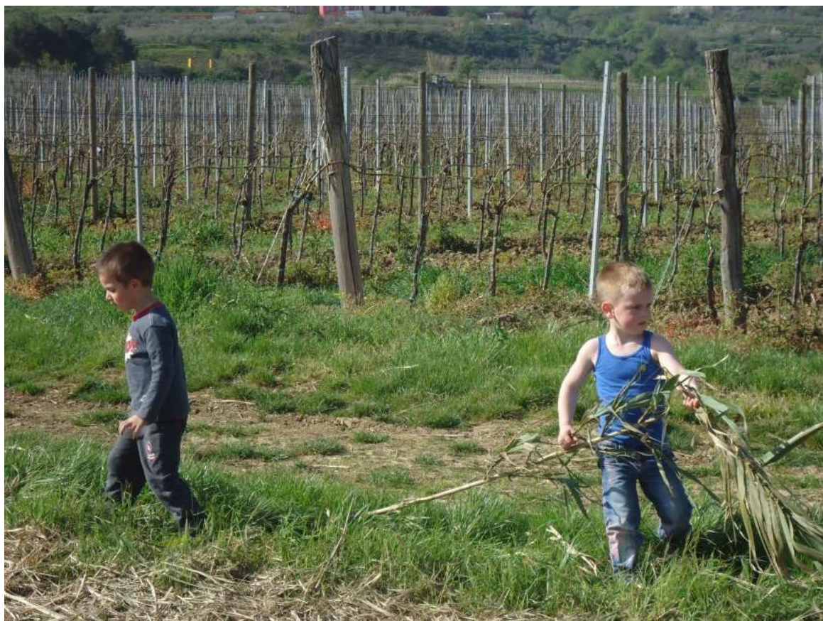
Sliki 19 in 20: Mali pustolovci.