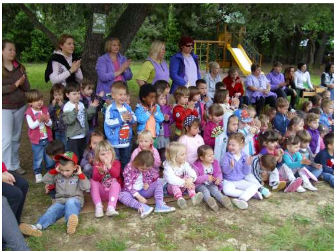
Slika 6: Gledalci so spodbujali nastopajoče.