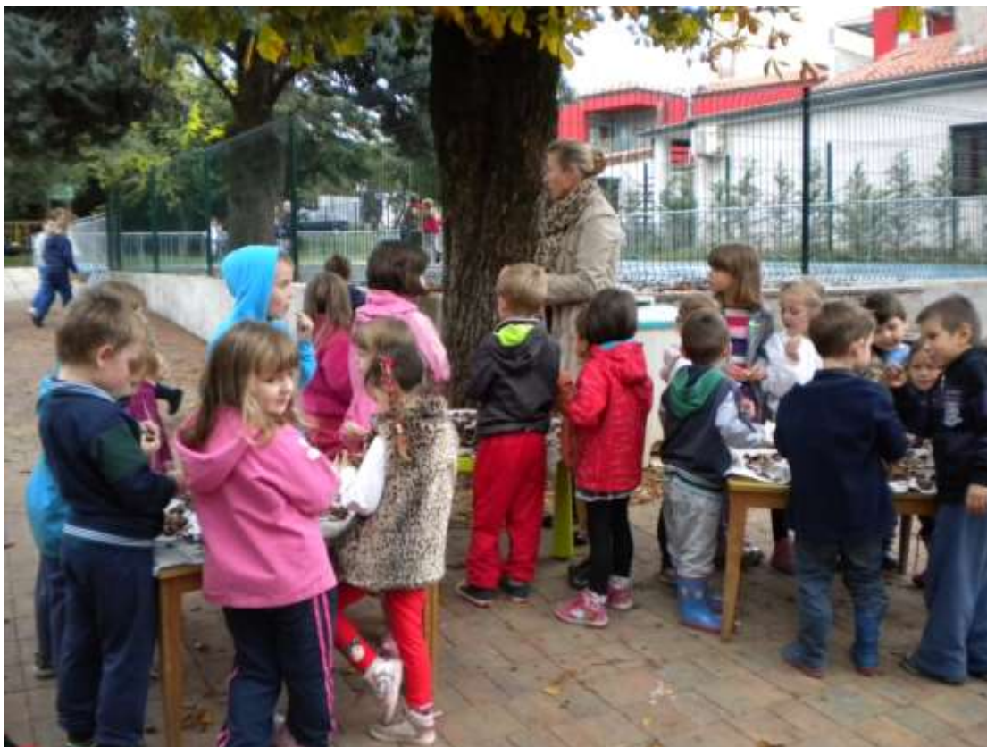
Sliki 5 in 6: Kostanjada