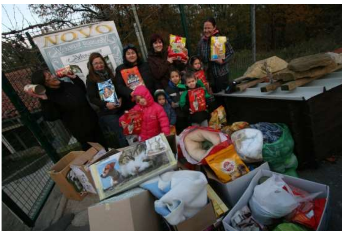
Slika 8: Obisk zavetišča v Svetem Antonu