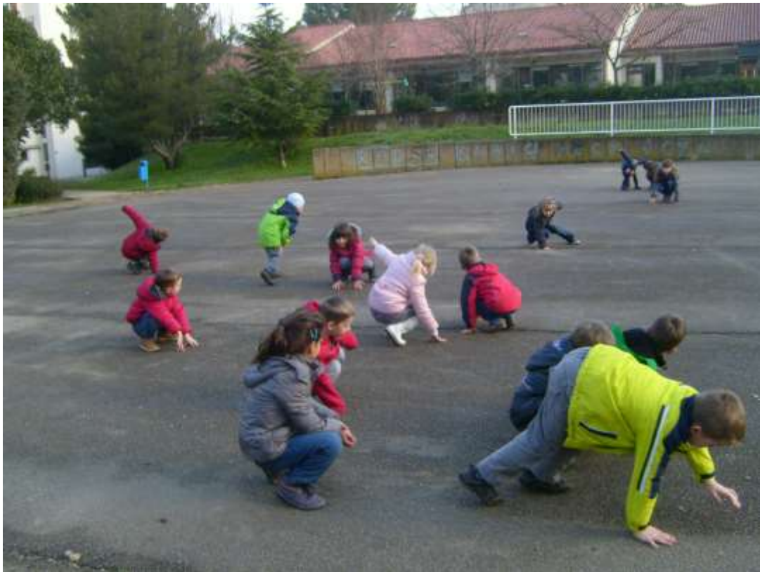
Slika 19: Gibalne igre na asfaltni površini.