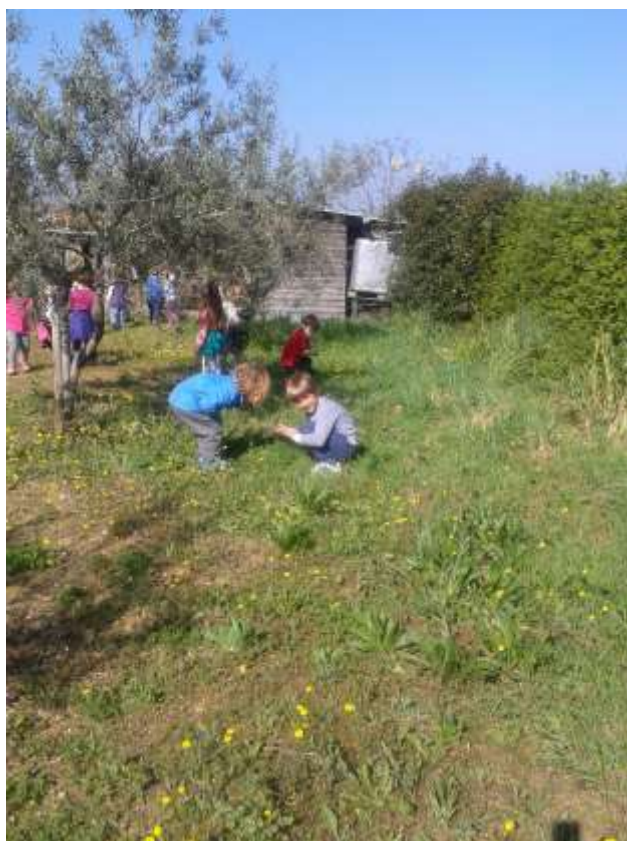
Slika 18: Raziskujmo okolico