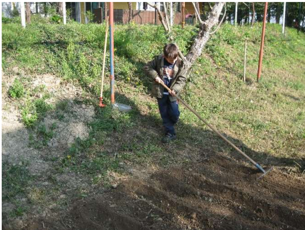
Sliki 2 in 3: Skrb za vrtniček.