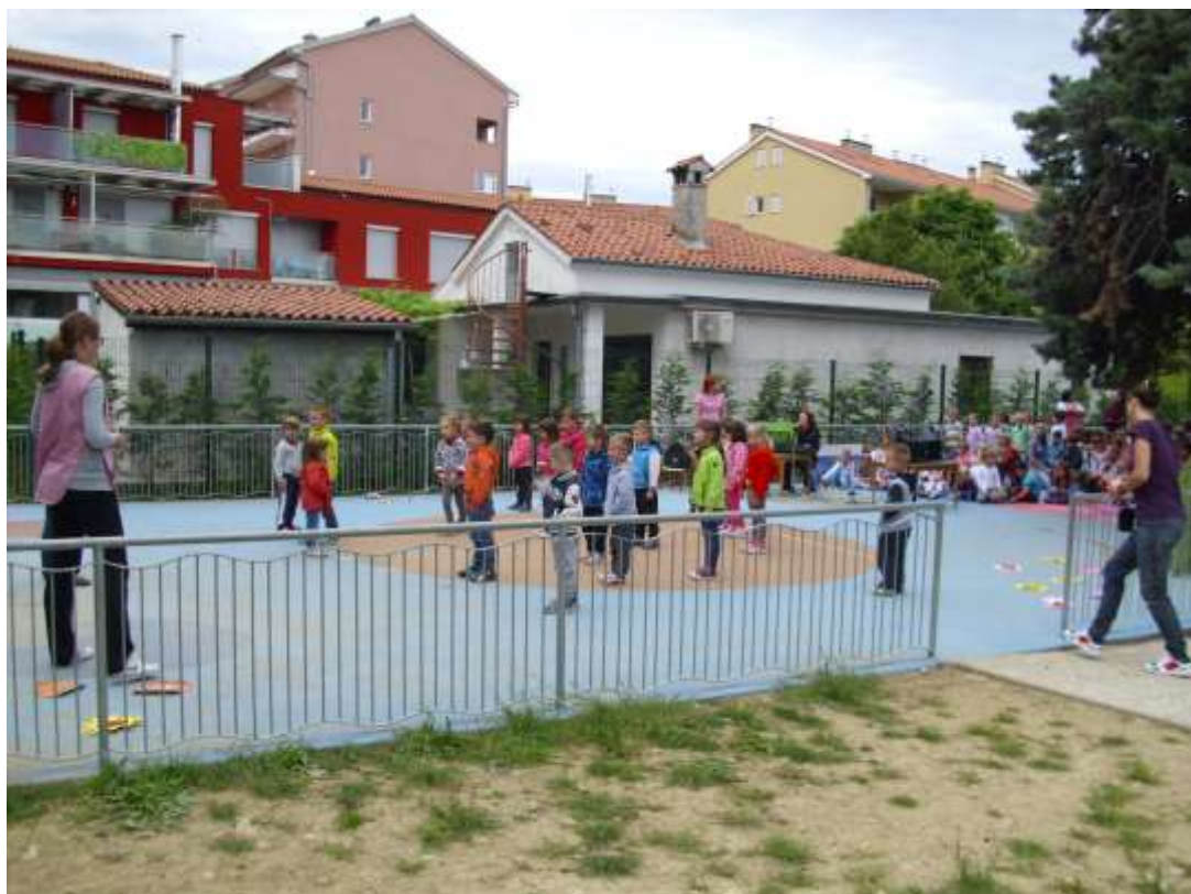
Slika 5: Nastop skupine Ježki.