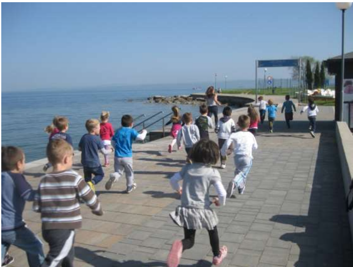
Slika 23: Kros ob dnevu zdravja v Simonovem zalivu