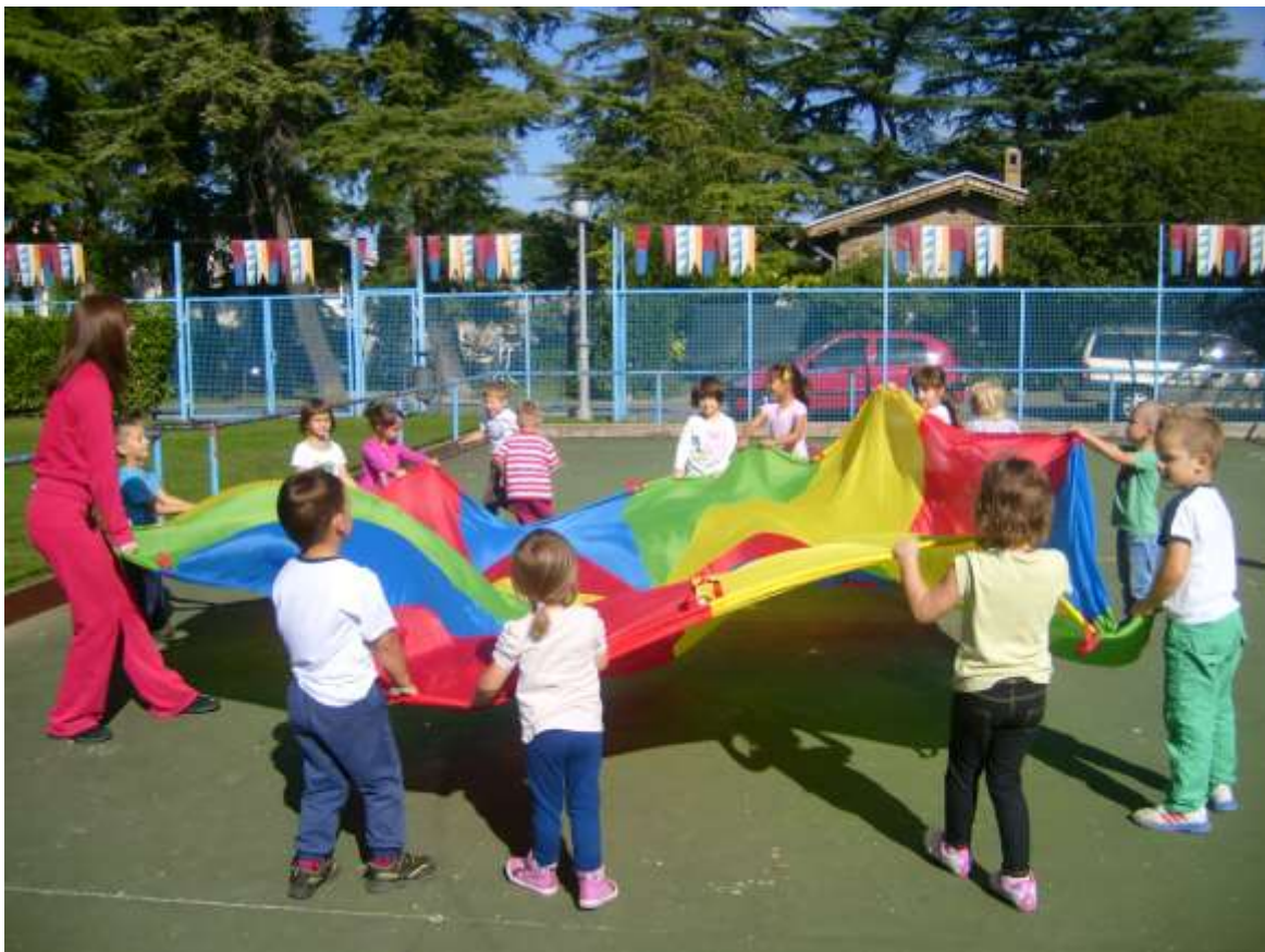
Slika 20: Igre s padalom.