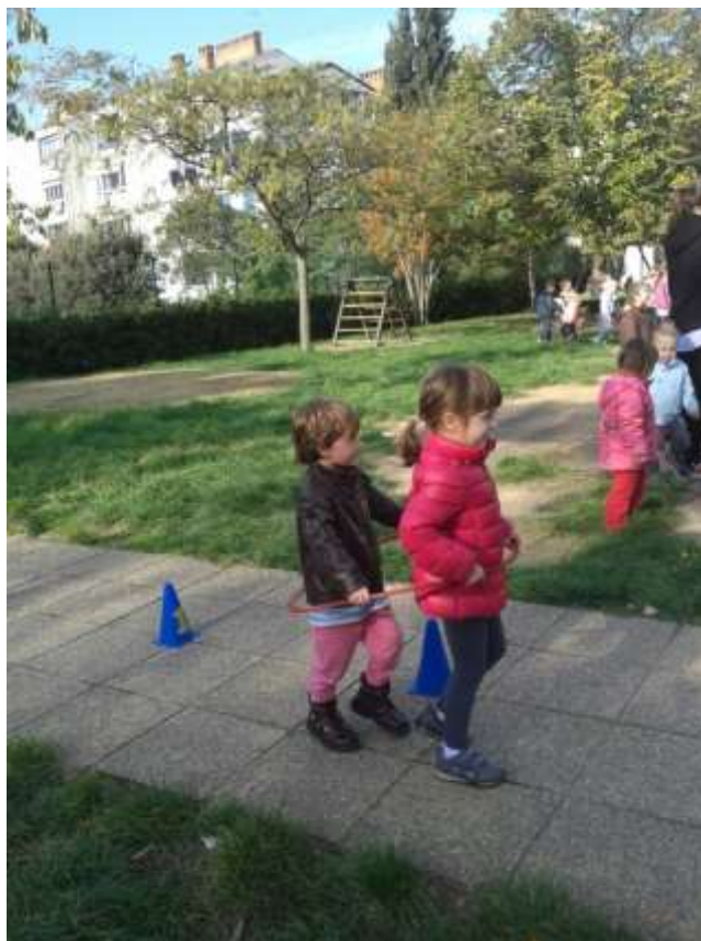
Sliki 1 in 2: Igre na igrišču