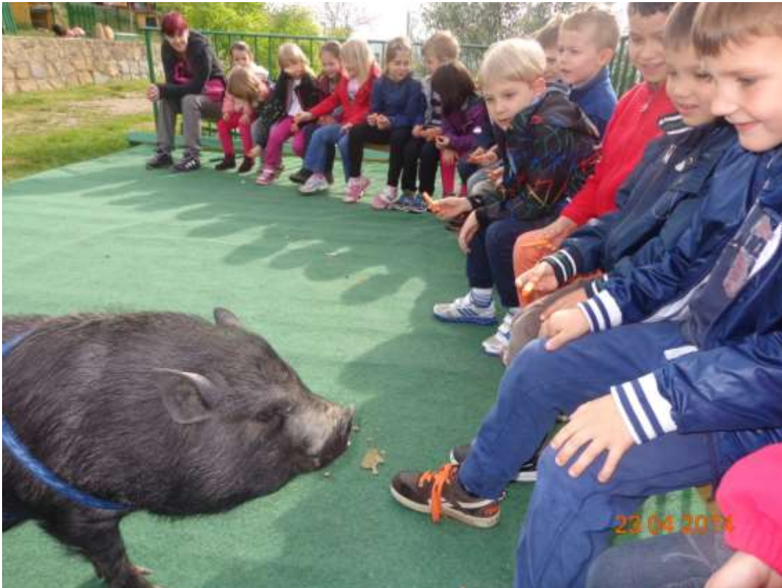
Slika 34: Obisk kmetije na Medljanu