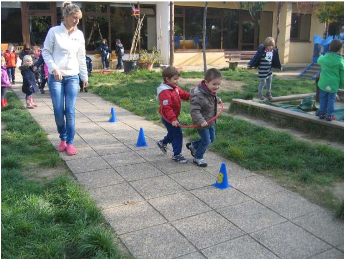
Sliki 5 in 6: Igre na igrišču