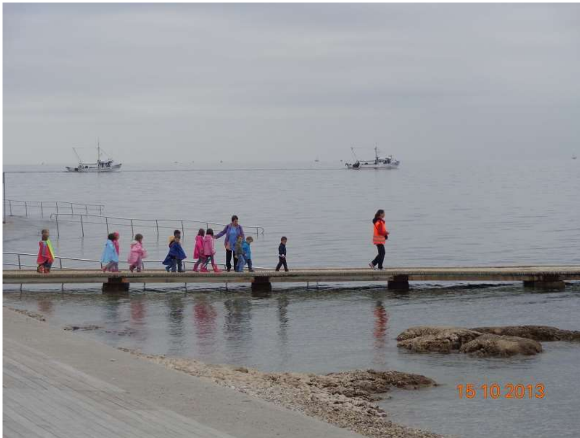
Slika 25: Tradicionalen pohod okoli naše Izole