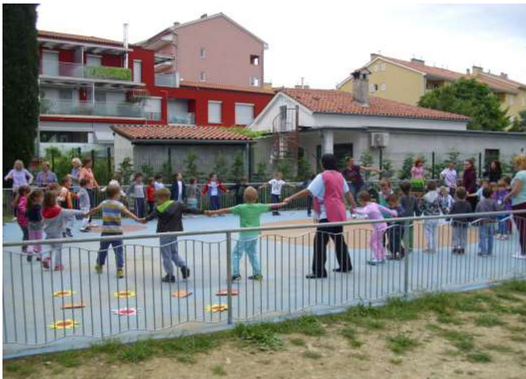
Slika 1: Nastop skupine Zmajček in skupine Želvice.