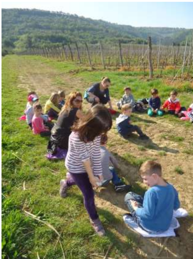
Sliki 23 in 24: Igramo se gnilo jajce.