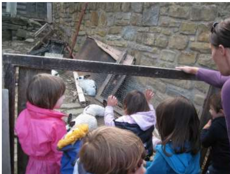
Slika 7: Pohod do Medoš – ogled domačih živali.