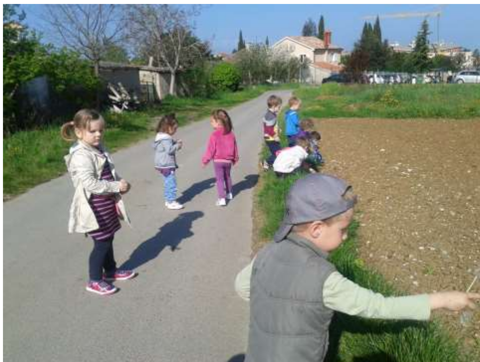
Sliki 27 in 28: Raziskovanje okolice, vrtilčkov, njiv, ...