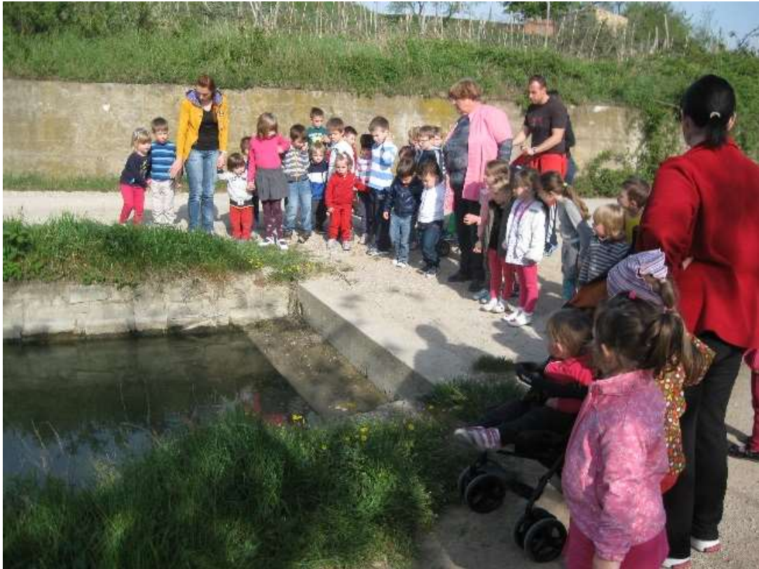
Slika 6: Mlaka ali »PUČ«.