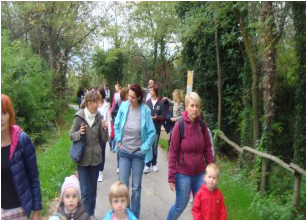
Sliki 15 in 16: Pohod s starši po Parencani in ogled domačih živali