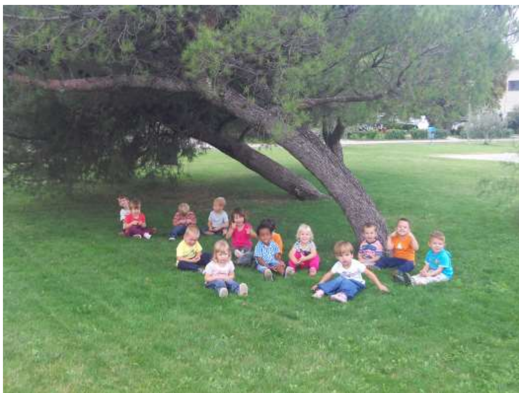
Slika 12: Ljudske rajalne igre, izštevanke, ... pod borovci.