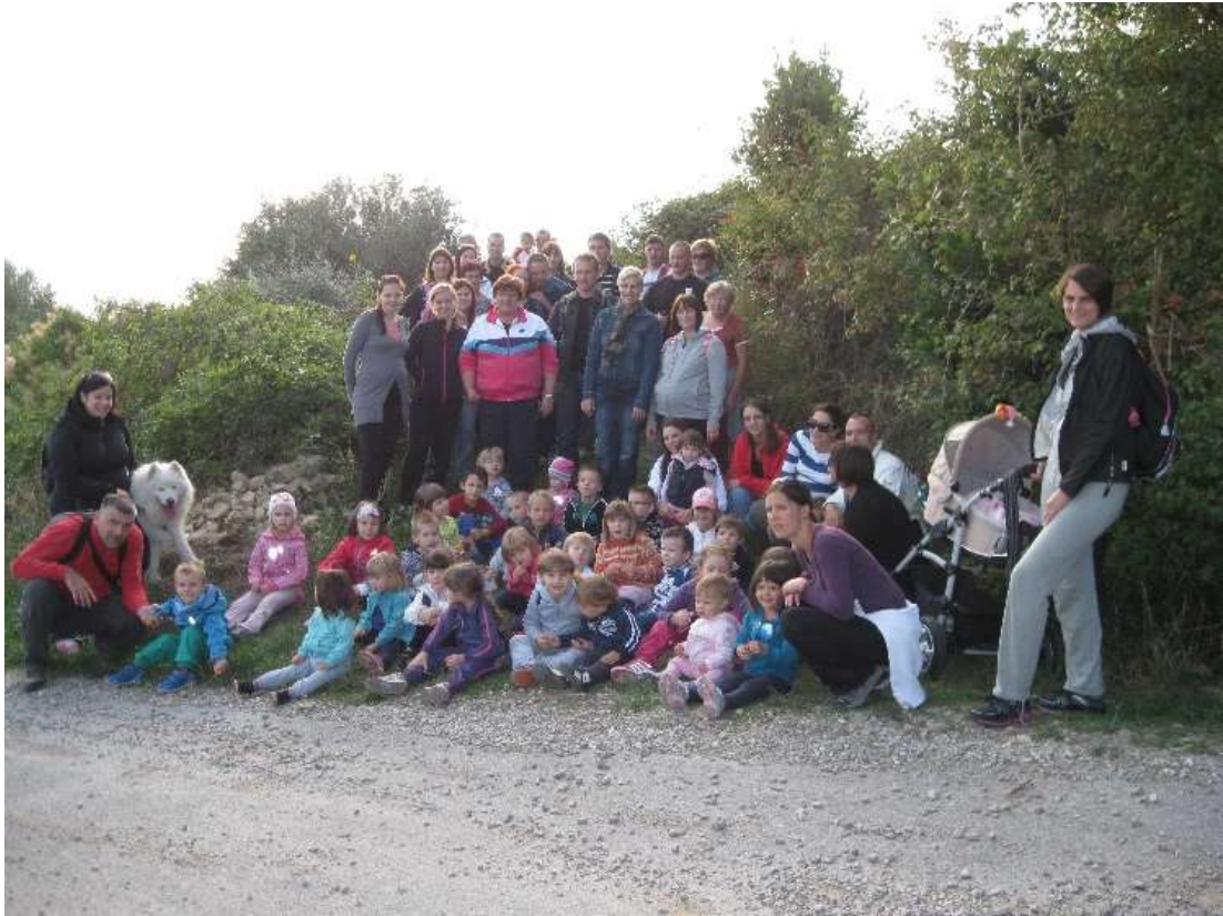
Slika 8: Pohod do Medoš.