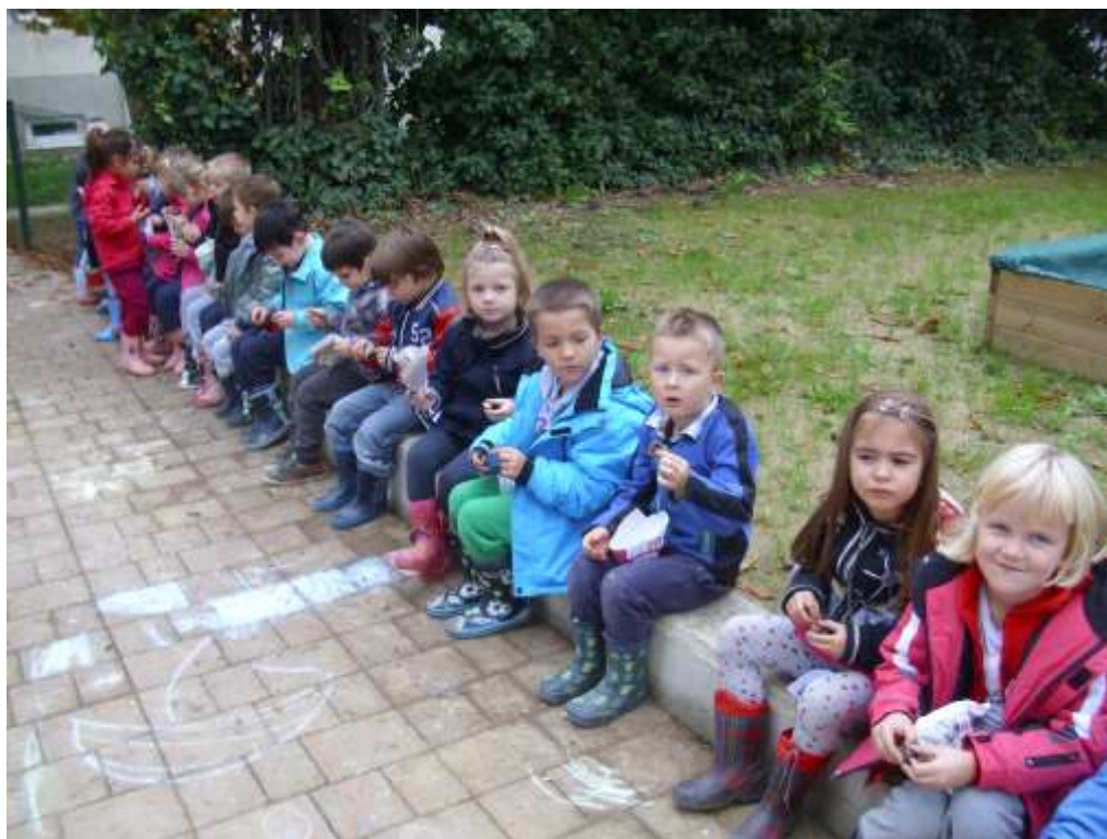
Slika 3: Dejavnosti na vrtčevem igrišču.