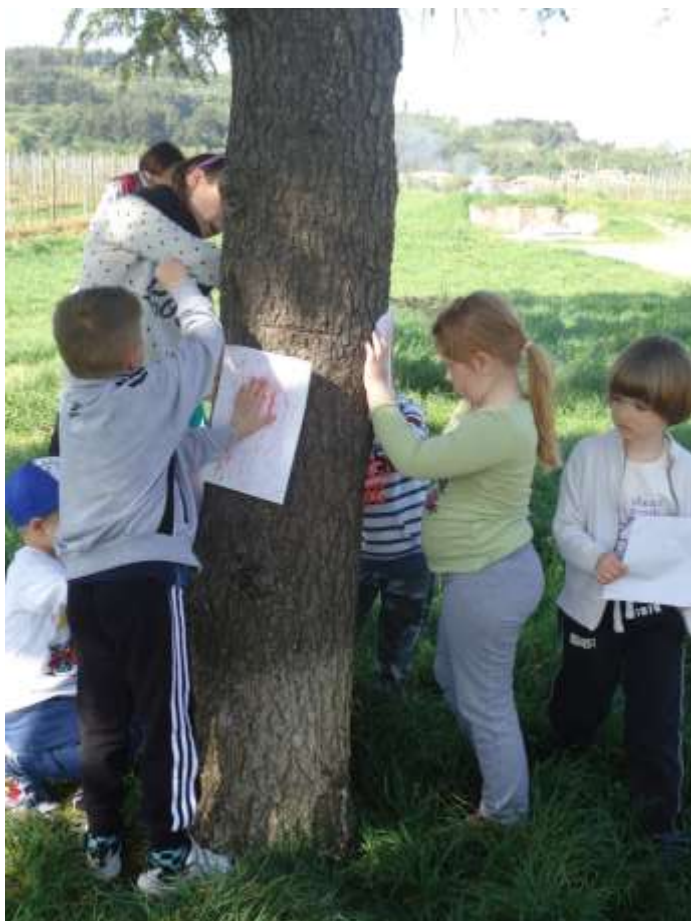
Slika 21 in 22: Drevo naš prijatelj