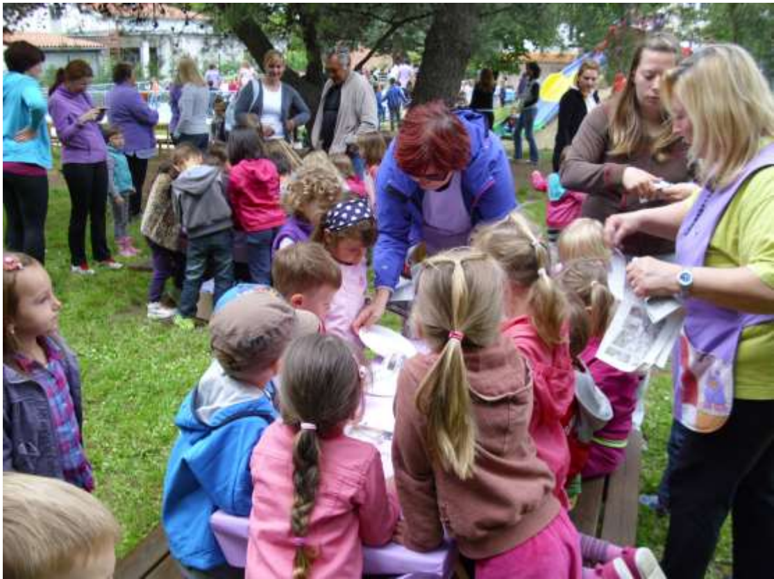
Sliki 7 in 8: Ustvarjalne delavnice.