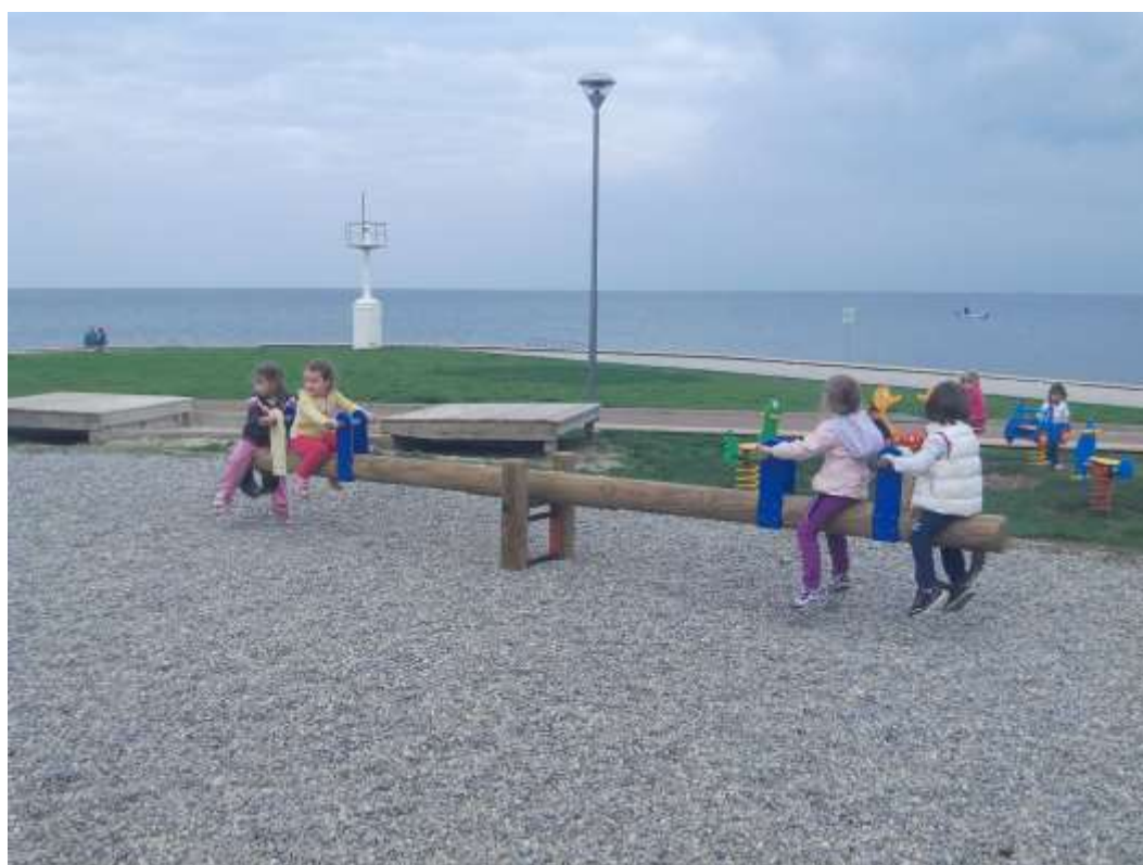
Slika 24: Igre na Svetilniku