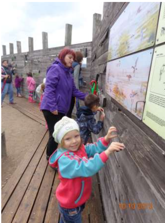
Slika 17: Obisk Škocjanskega zatoka