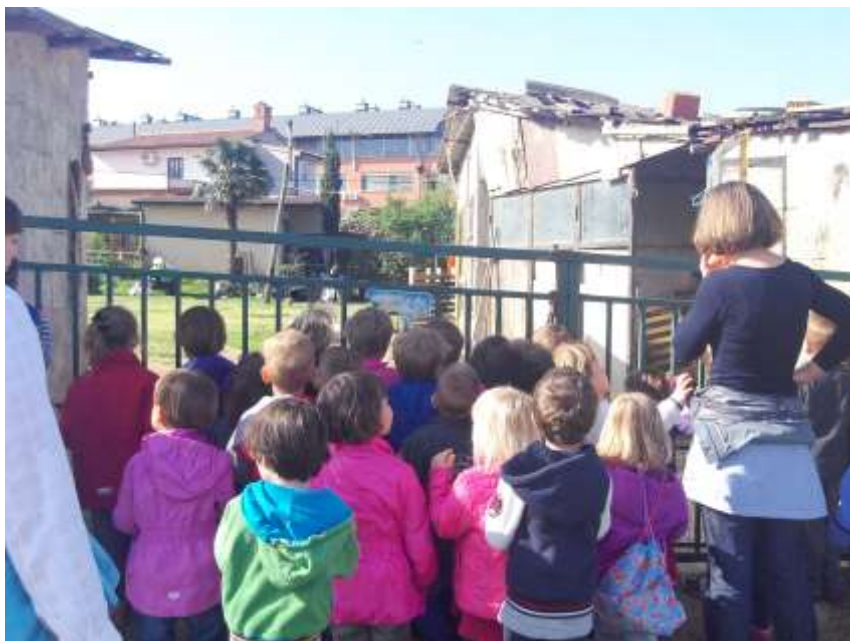
Slike 29- 31: Oglad kmečkega dvorišča sredi mesta.