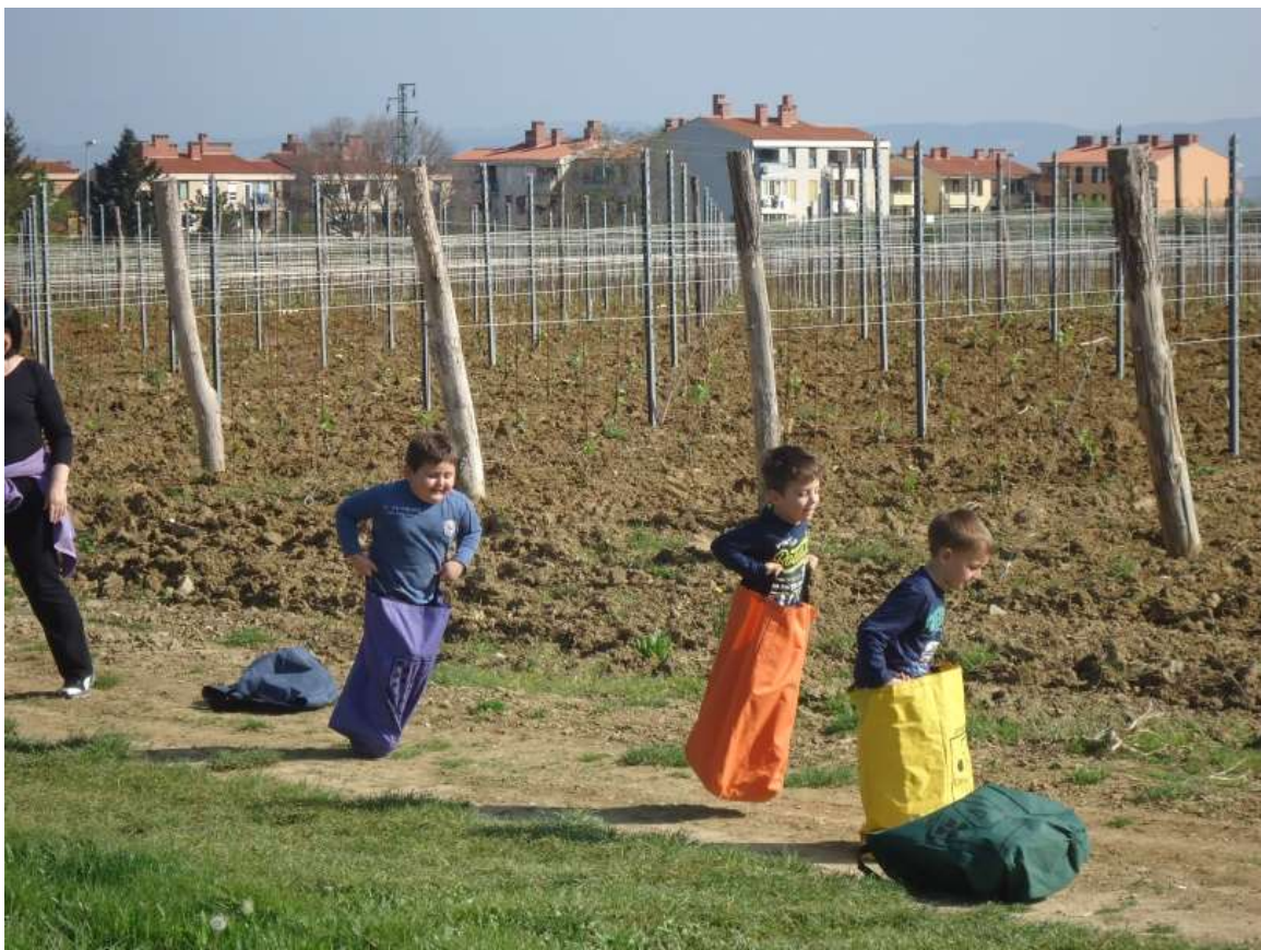
Sliki 17 in 18: Skakanje z vrečami.