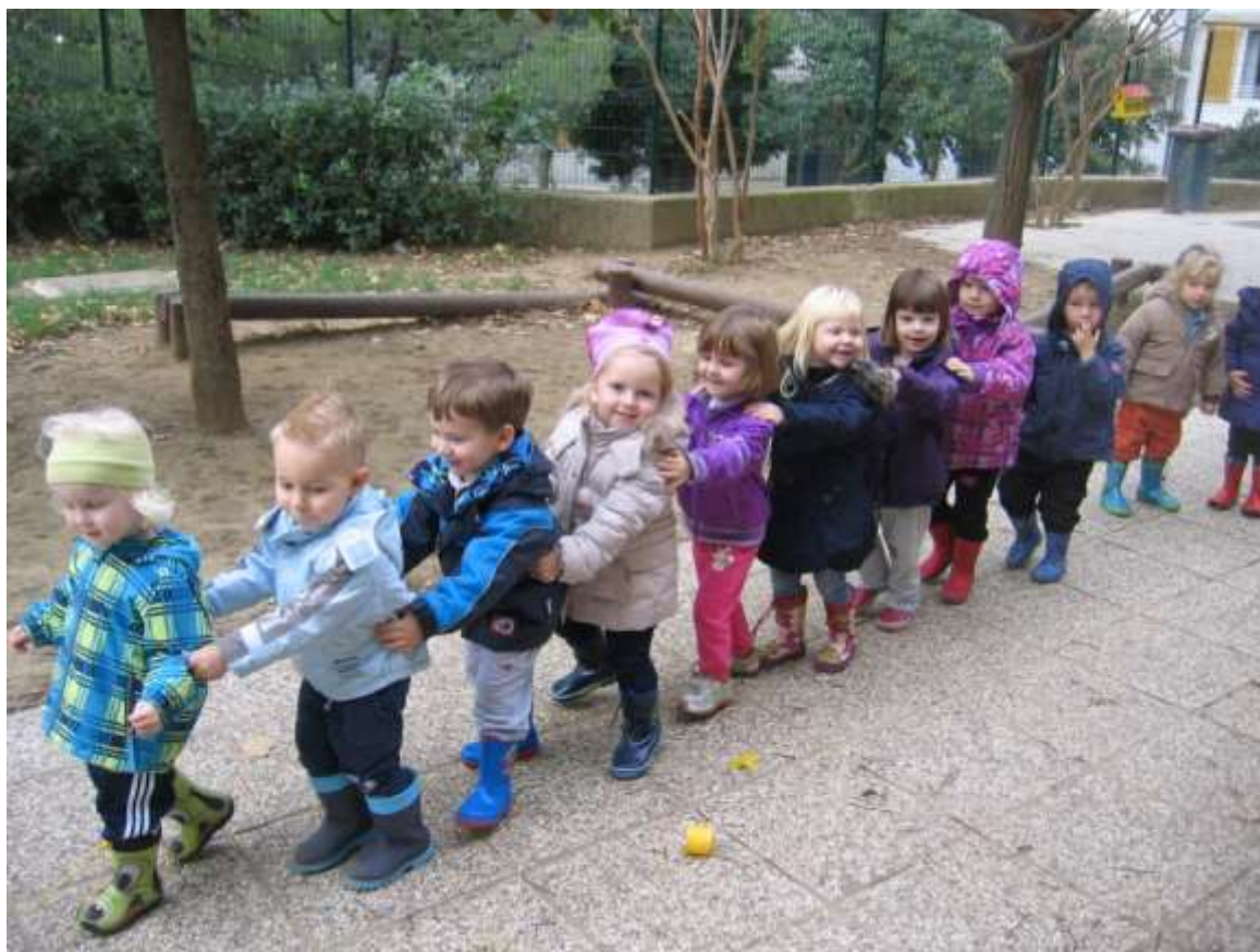
Sliki 25 in 26: Vlakec.