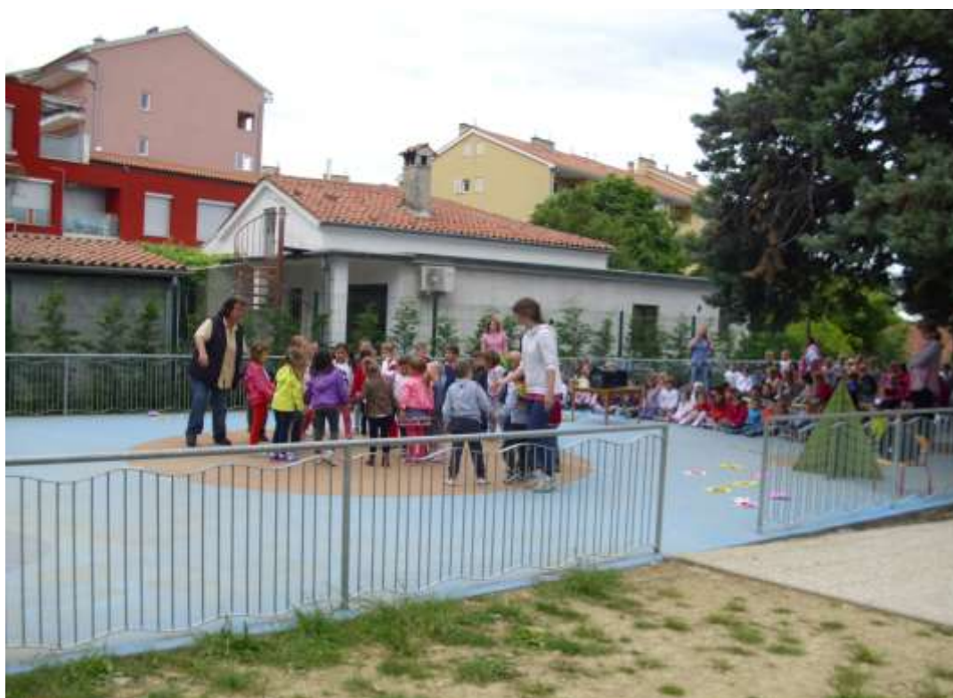
Slika 2: Nastop italijanskega krožka.