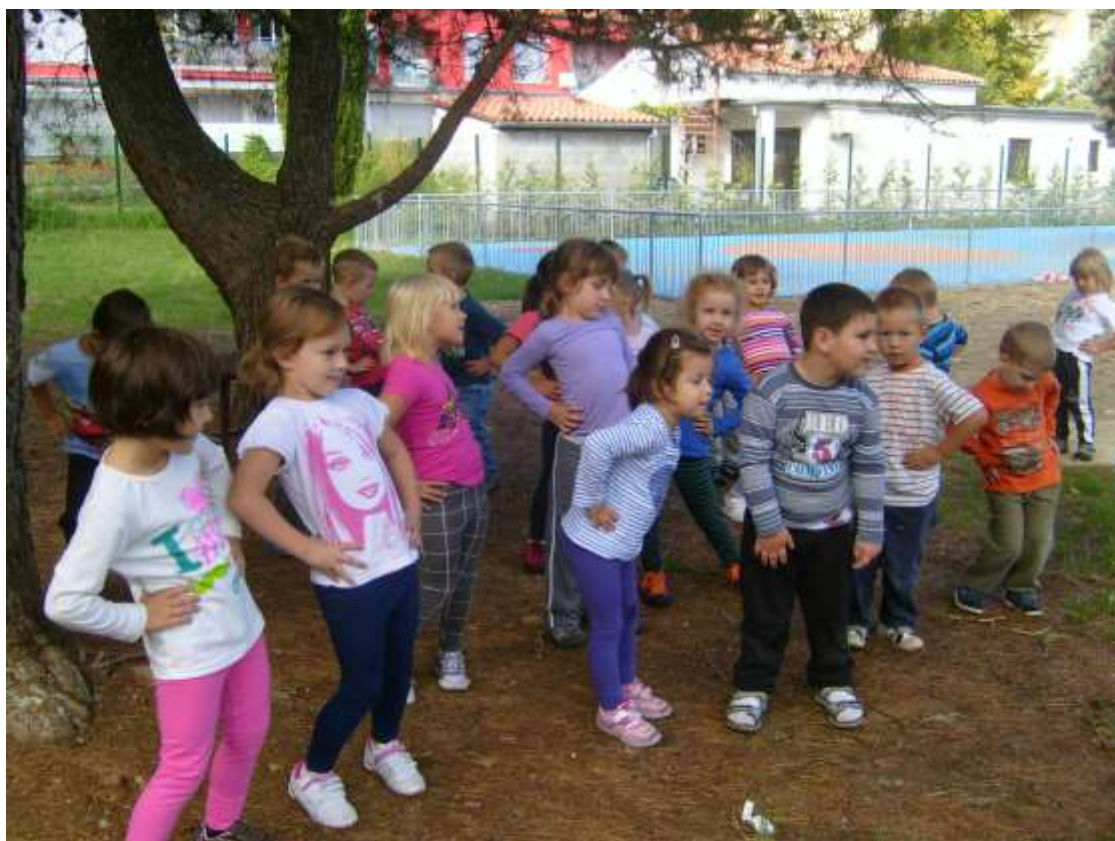
Slika 4: Trim steza – vadba po postajah na vrtčevem igrišču.