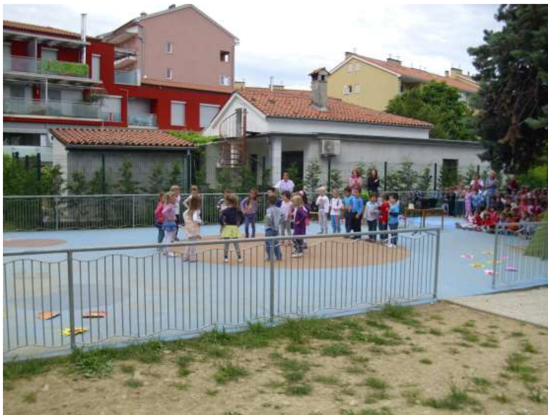
Sliki 3in 4: Nastop skupine Mavrične ribice in plesno-dramskega krožka.