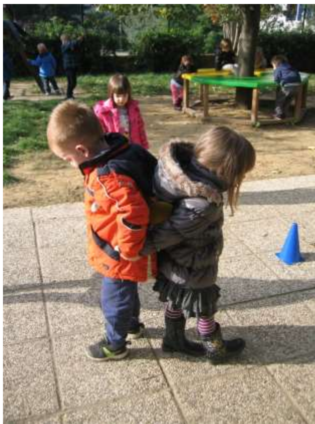
Sliki 3 in 4: Igre na igrišču