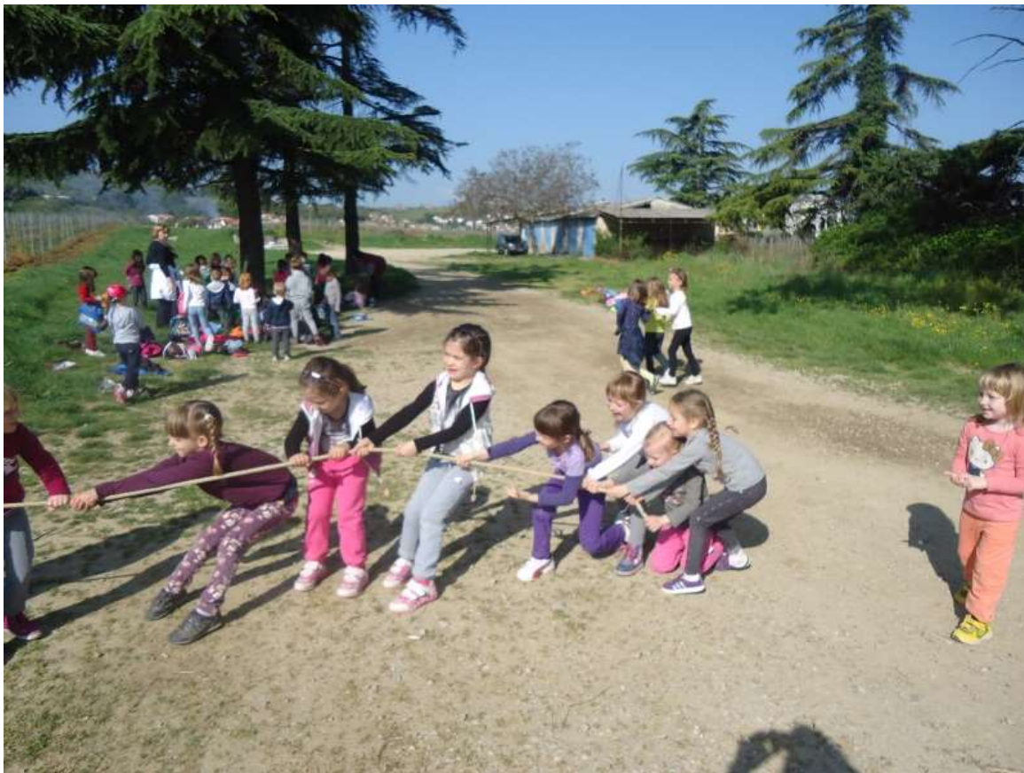
Sliki 13 in 14: Poiskujemo se v različnih igrah