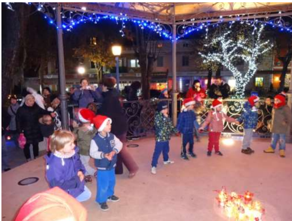
Slika 7: Sprehod po okrašenem mestu z lanternami