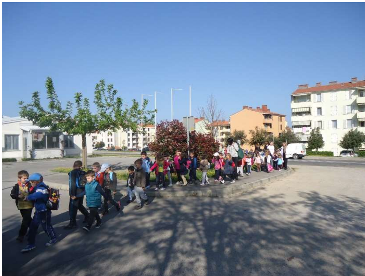
Sliki 7 in 8: Odpravili smo se na piknik