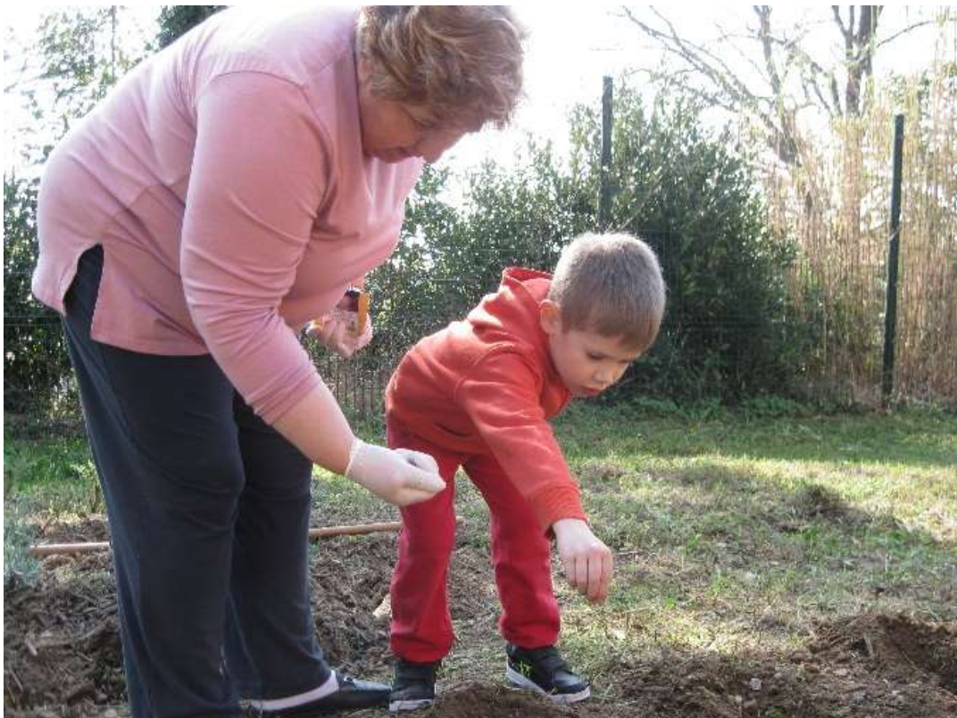
Slika 1: Na našem vrtničku sejemo različna semena.

Ogledali smo si semena ter izbrali zelenjavo, ki smo jo nato tudi posejali. Pri sejanju smo sodelovali vsi, od malih do velikih. Sedaj vrtniček pridno zalivamo in ga urejamo. Vsi komaj čakamo, da na njem zraste naša zelenjava.