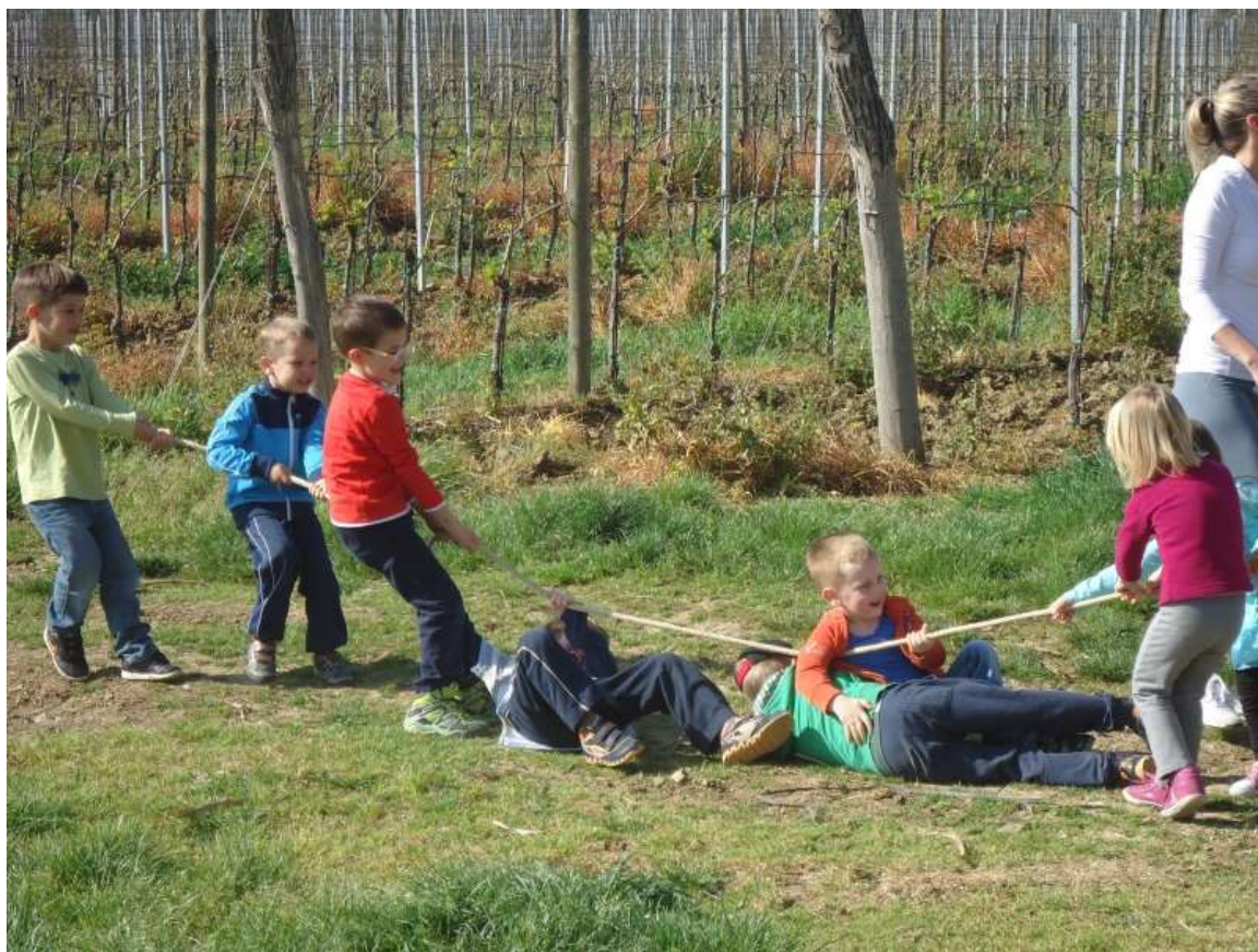
Sliki 11 in 12: Vlečenje vrvi.