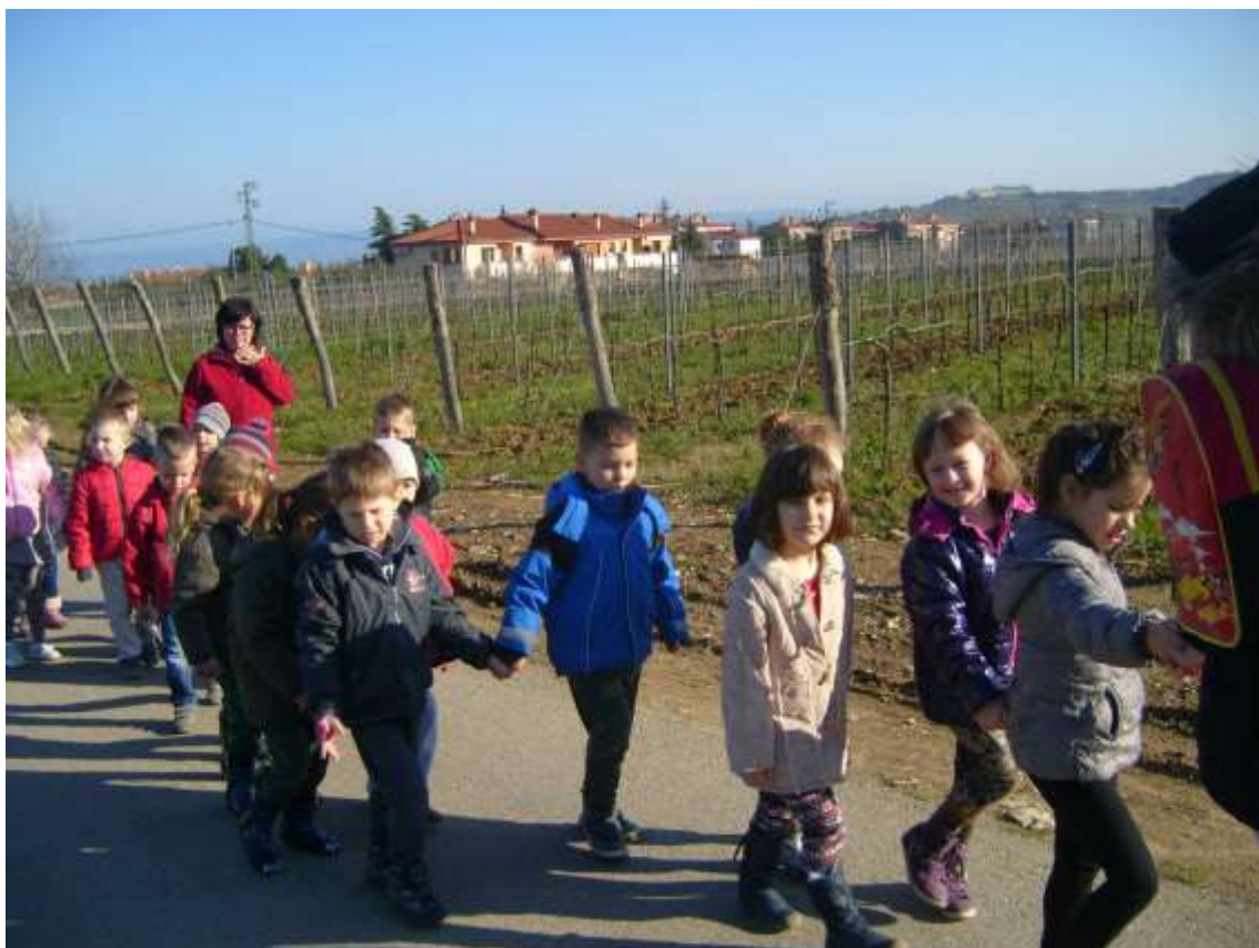
Slika 11: Pohod do tunela.