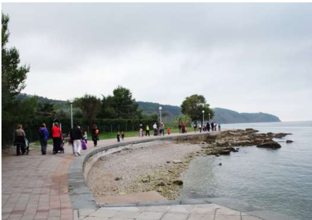
Sliki 21 in 22: Pohod s starši ter razigranost ob naši obali