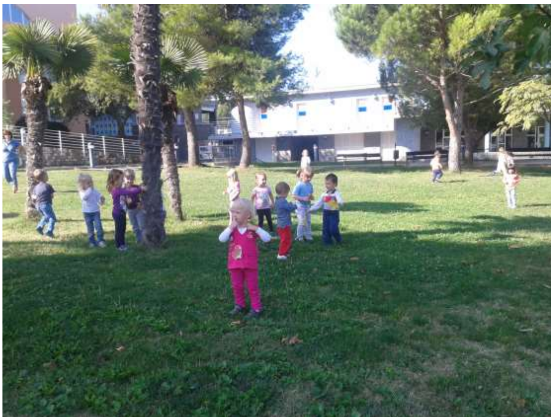
Sliki 13 in 14: Skupinske igre na travnatih površinah ob obali